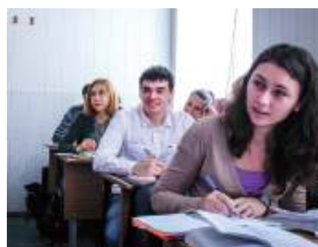
Студенты 2 курса , бакалавриата по направлению «экономика»

В от уже второй год как мы учимся в стенах нашего любимого факультета. Уже второй год как мы обогащаемся знаниями и бесценным опытом, который нам дают наши преподаватели. Сам факультет для нас стал вторым домом. Домом, который свёл вместе и сплотил, казалось бы совершенно разных людей. Хотим от всей души поздравить экономический факультет с такой знаменательной датой - 50 лет! И пожелать процветания, долгих лет существования и хороших студентов, прославляющих имя Экономического факультета.