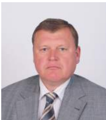
Юрий Викторович ВАСИЛЬЕВ выпускник 1974 года Депутат Государственной Думы Федерального Собрания Российской Федерации